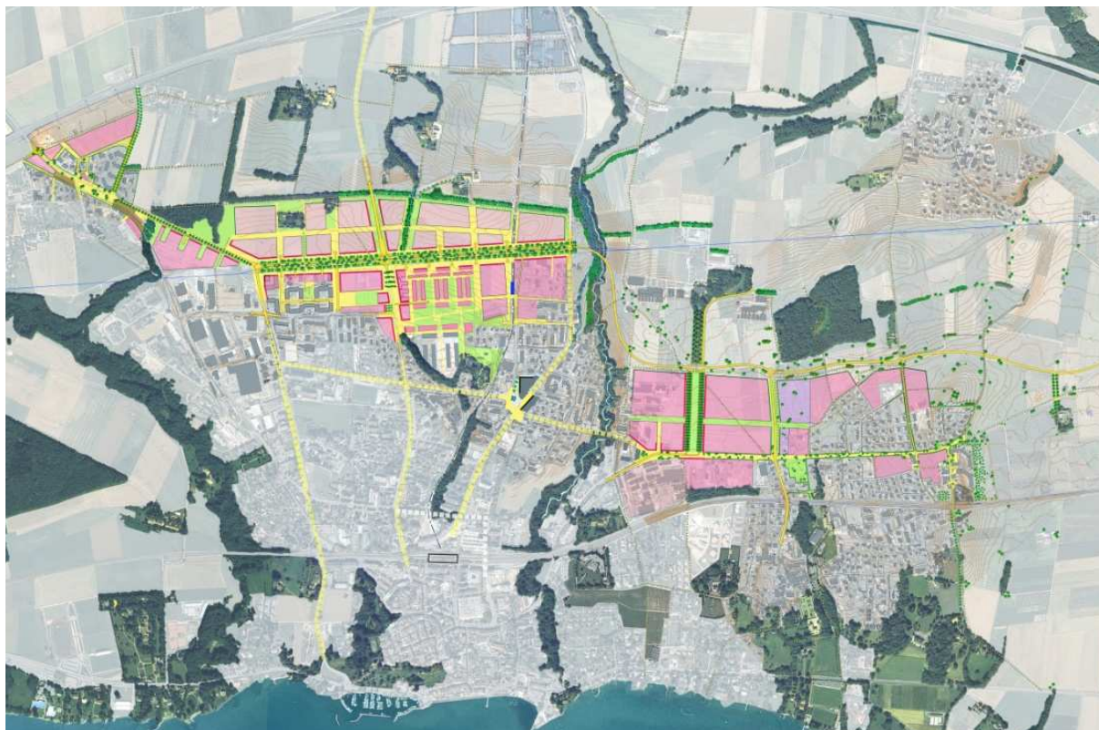
Concept du développement urbain de l'agglomération Eysins-Nyon-Prangins à l'horizon 2030

La commune d'Eysins fait partie du schéma directeur de l'agglomération nyonnaise (SDAN), adopté en 2006 par les différents partenaires 1 . Par ce document, les partenaires se sont mis d'accord sur les grands principes de développement de l'agglomération nyonnaise. Plusieurs projets spécifiques ont été identifiés dont celui du développement urbain le long de la route de distribution urbaine (RDU) qui concerne directement les communes d'Eysins, Nyon et Prangins.